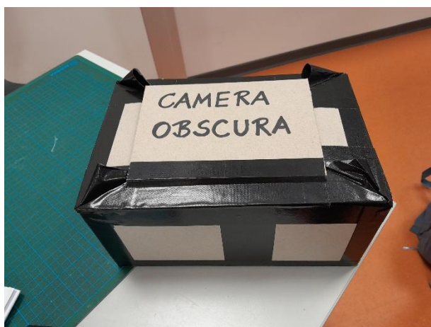
Eine Kamera-Obscura in fertig.