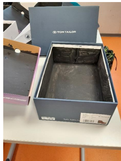
Eine Kamera-Obscura im bau.